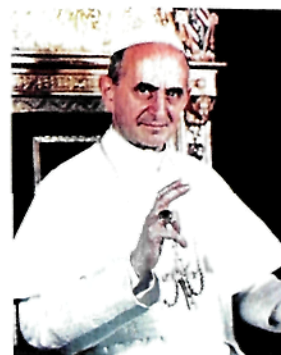
(blaženi papa Pavao VI)

„Vjera nam se neće više činiti teret, nego snaga i radost; nećemo se više bojati uroniti u profani život svijeta, u kojemu nećemo više biti izgubljeni i u opasnosti, nego mirni i snažni svjedoci večernje i noćne svjetlosti, vjere u sadašnjem vremenu, navjesticateljice punoga svjetla vječnoga dana.“