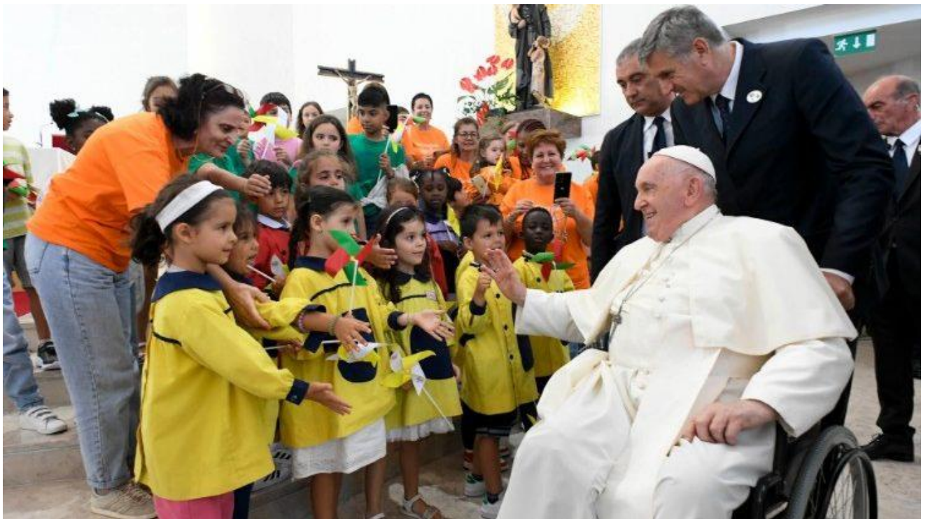
Susret je održan u župnom socijalnom centru Svetog Vinka Paulskog

Kad ne gubimo vrijeme žaleći se na stvarnost, nego se brinemo za zadovoljenje konkretnih potreba ljudi, s radošću i povjerenjem u Božju providnost, tada se mogu dogoditi prekrasne stvari. O tome svjedoči vaša povijest: iz susreta s pogledom starca uz cestu nastao je “svestrani” dobrotvorni centar, kao što je ovaj ovdje; iz odgovora na moralni i društveni izazov te iz “kampanje za život” rodila se udruga koja pomaže budućim majkama i obiteljima koje čekaju djecu, djeci i mladima u teškoćama kako bi pronašli mogućnost sigurnog života; iz iskustva bolesti oblikovana je zajednica za podršku onima koji se suočavaju s bitkom s rakom. Hvala vam za sve što činite! Nastavite, s nježnošću i dobrotom, prihvaćati izazove koje sa sobom nosi stvarnost, sa svojim starim i novim oblicima siromaštva, i kreativno i hrabro odgovoriti na konkretan način, pozvao je Papa.