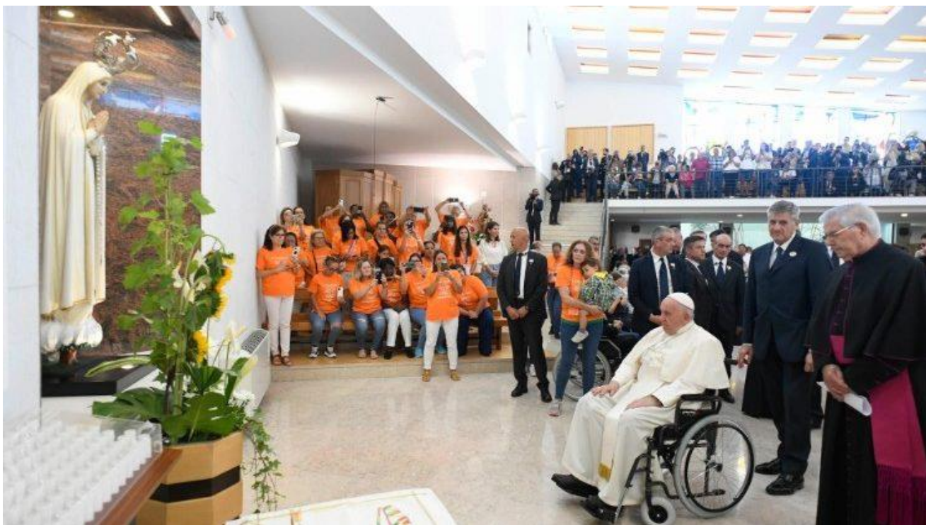
Sveti Otac molio se pred kipom Blažene Djevice Marije

Volimo na taj način! Molim vas, nastavite činiti život darom ljubavi i radosti. Zahvaljujem vam i molim vas – sve, a posebno mlade – da i dalje molite za mene. Obrigado!, pozvao je Papa.