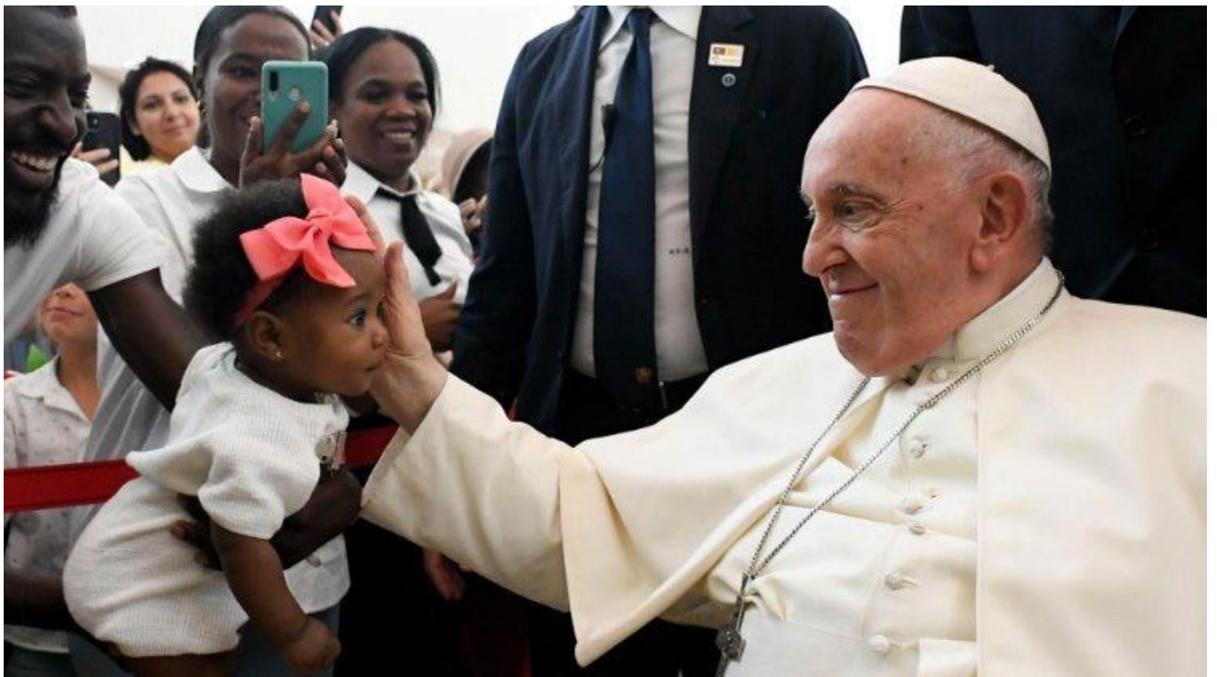
Papa Franjo susreo s predstavnicima nekih karitativnih i socijalnih udruga i centara

Milosrđe je ishodište i cilj našeg kršćanskog puta, a vaša prisutnost, koja je konkretan podsjetnik na “ljubav na djelu”, pomaže nam da ne smetemo s uma pravac puta, smisao onoga što neprestano činimo, rekao je Papa na početku svog obraćanja sudionicima susreta. Zahvalivši im na njihovim svjedočanstvima, Papa je istaknuo tri vida njihova svjedočenja: činiti dobro zajedno, djelovati konkretno i biti blizu najslabijima.